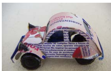
Art nr 741 Citroën 2CV L=7,5cm