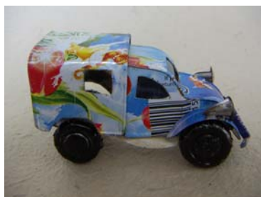
Art nr 751 Citroën CV3 L=7,5cm