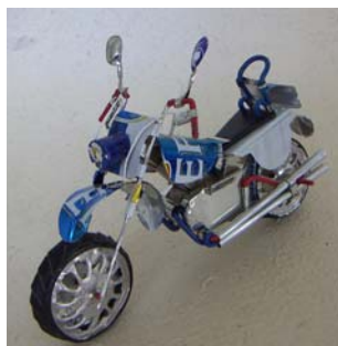
Art nr 722 Motorcykel L=20cm