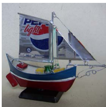
Art nr 701 Fraktbåt H=17cm L=22cm