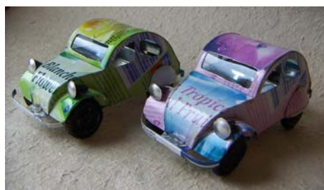
Art nr 742 Citroën 2CV L=11cm