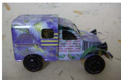
Art nr 752 Citroën CV3 L=11cm