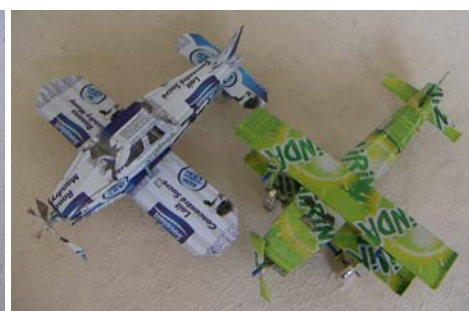
Art nr 734 Flygplan - classic Dubbla vingar. Tre propellrar. L=19cm Art nr 735 Flygplan Inrikes Propeller i fören. L=19cm