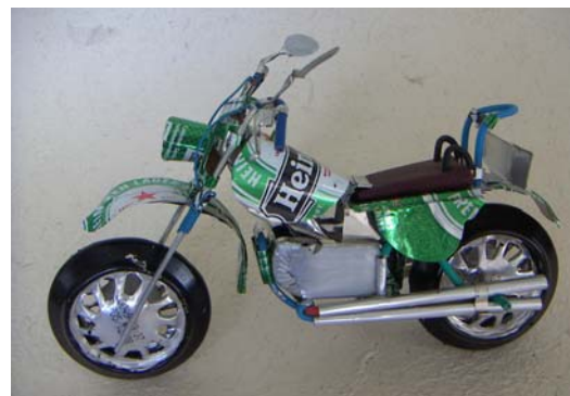
Art nr 723 Motorcykel L=23cm