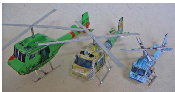
Art nr 731 Helikopter PM L=13cm Art nr 732 Helikopter MM L=15cm Art nr 733 Helikopter GM L=23cm Alla med två skjutdörrar som kan öppnas.