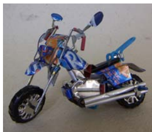
Art nr 721 Motorcykel L=15cm