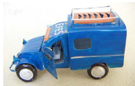
Art nr 753 Citroën 3CV Huvu, förarhyttens och lastutrymmets dörrar kan öppnas. Målad med undantag för taket där burken presenterar sig. L=16cm H=9,5cm