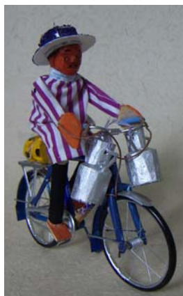
Art nr 711 Cyklist från Antananarivo H=15cm

Hjälper till att avvärja ett växande miljöproblem. Gör metallskräpet till resurs. Återvinning – Hela Världen Vinner Genuint, småskaligt hantverk. Båtfraktat. Rättvis Handel.