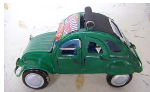
Art nr 743 Citroën 2CV Samtliga 4 dörrar, huv och koffert kan öppnas. Bilen är målad med undantag för taket där burken presenterar sig. L=15cm H=8cm