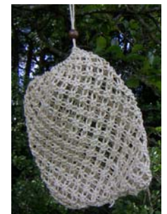
Art nr 229 Spa-bag