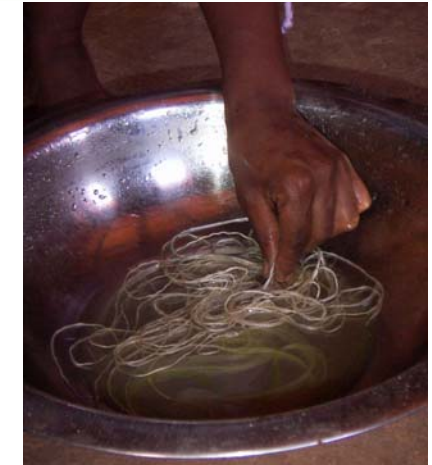
Steg 3) Sisalfibrerna erhållits sköljs i vatten.