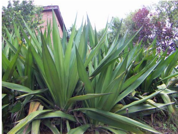
Steg 1) Sisalblad plockas. Det växer många olika sorters sisal i omgivningarna. Sisalen är här vildväxande. Bilden ovan visar den typ av sisal Eva helst använder i sin tillverkning: Det är en sisal vars fibrer är långa, jämna och starka.