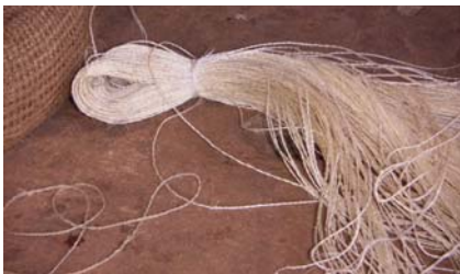
Steg 4) Eva tvinnar sisalfibrerna till tråd. Trådens tjocklek anpassas efter vad den skall användas till. Eventuell färgning görs med ÖKO-TEX certifierade färgämnen.