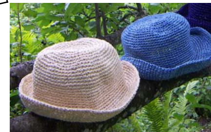
Art nr 256 Chapeau Sisal