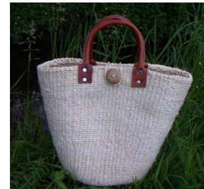
Art nr 24531 Väska Rustique

Hantverk från Madagaskar med respekt för natur, människa och tradition. www.la-maison-afrique.se RÄTTVIS HANDEL