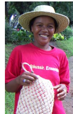
Art nr 229 Spa-bag