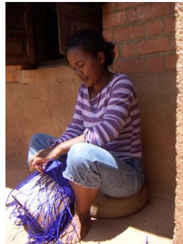
Steg 5) Sisaltråden virkas till hatt ...eller knyts till axelväska. Hela processen från sisalplanta till färdig hatt och väska med handkraft och på en och samma plats. Produktion med litet ekologiskt fotavtryck, stort förädlingsvärde.